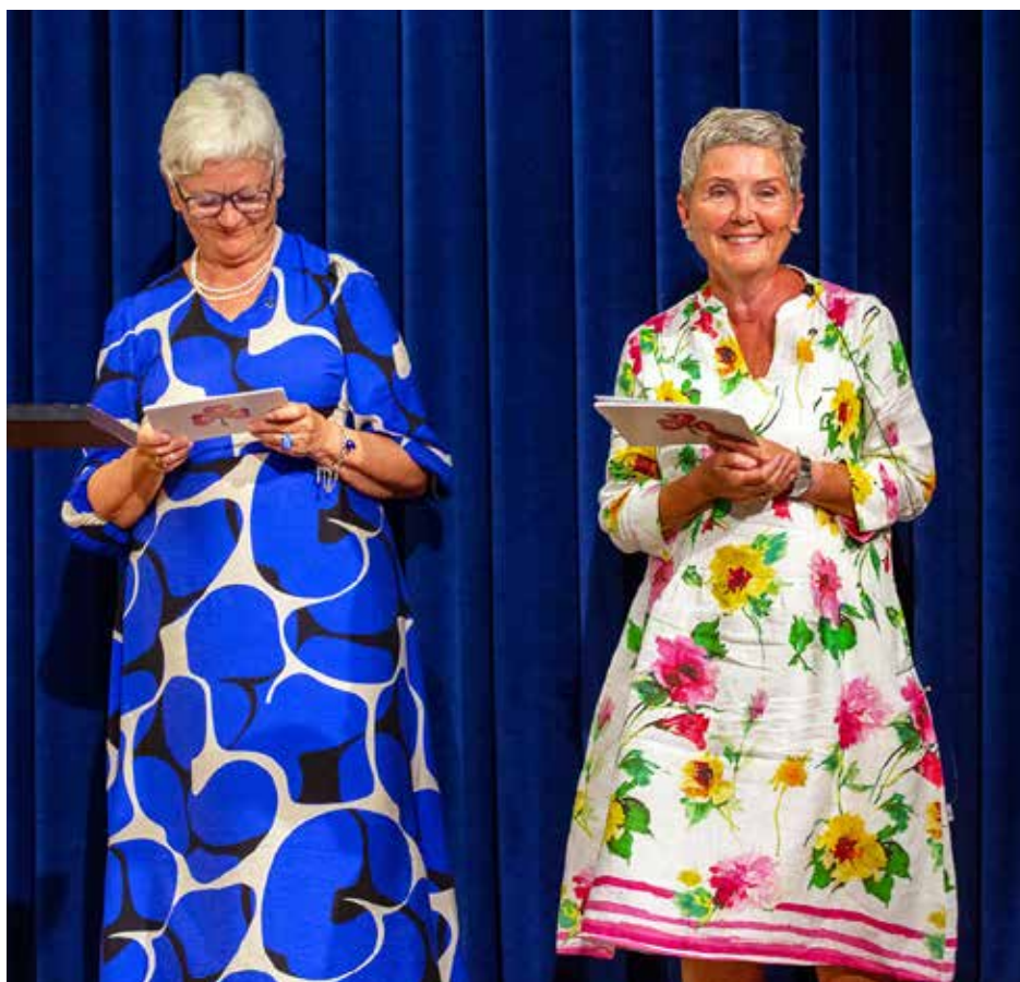
Kvinneutvalgets rapport setter spor etter seg i form av økt interesse for kvinners helse.

Konferansen var et samarbeid mellom Drammen sanitetsforening og Drammen kommune. Det blåser en kvinnehelsevind over landet, noe fulle hus der det arrangeres slike konferanser er et bevis på.