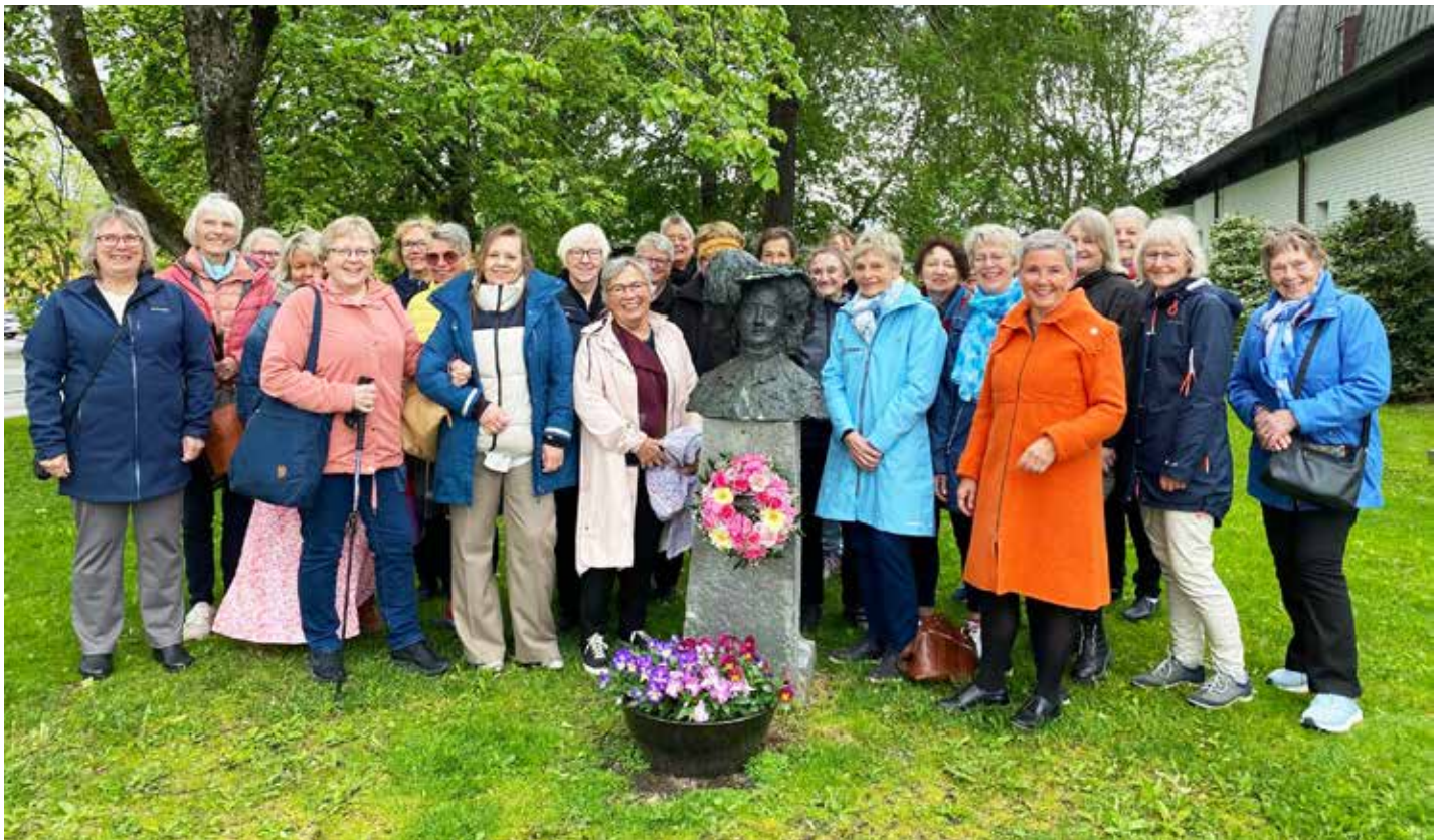
LITT AV EI DAME: Fredrikke Marie Qvam ble født 31. mai 1843 i Nidaros, og døde 10. september 1938 på Gjevran Gård ved Steinkjer.

Sist på programmet var eldre kvinners helse. Da ble det snakket om hvordan man kan sikre god helse og livskvalitet i godt voksen alder?