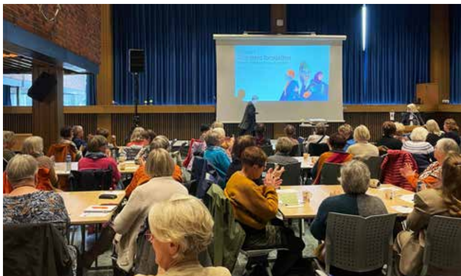
DELTAKERE FRA HELE LANDET: Det var fullt i rådhusalen i Steinkjer da den nasjonale konferansen ble arrangert lørdag.

– Fredrikke Marie Qvam var med og stiftet den organisasjonen som skulle vise seg å bli en viktig samfunnsbygger.