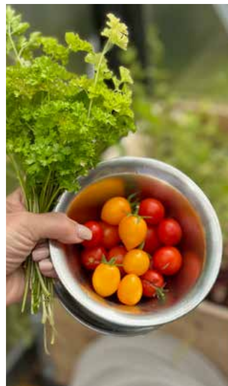
Å se ting gro gjør godt, og på Grefsenlia høstes det både urter og grønnsaker.

Grefsenlia er et godt sted å være. Tverrfaglig kompetanse med leger, fysioterapeuter, psykologer, sykepleiere, helsefagarbeidere, og miljøterapeuter samarbeider for pasientene og beboernes beste. Og så har de en egen kulturmedarbeider, som jobber for hele huset.