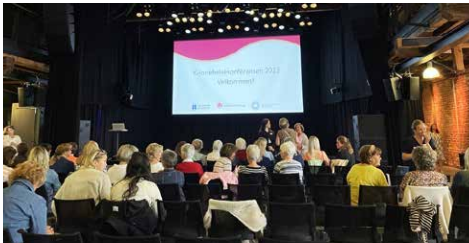
Også i Drammen trakk kvinnehelse fullt hus.

Sanitetskvinnene i Sør-Trøndelag stilte spørsmålet: Hvordan får vi til at kvinnefeltet prioriteres og utvikles. Her kunne lokale fagfolk og politikere diskutere hvordan vi får til et helsetilbud, og spesielt med tanke på hva som kan gjøres lokalt i kommunen.