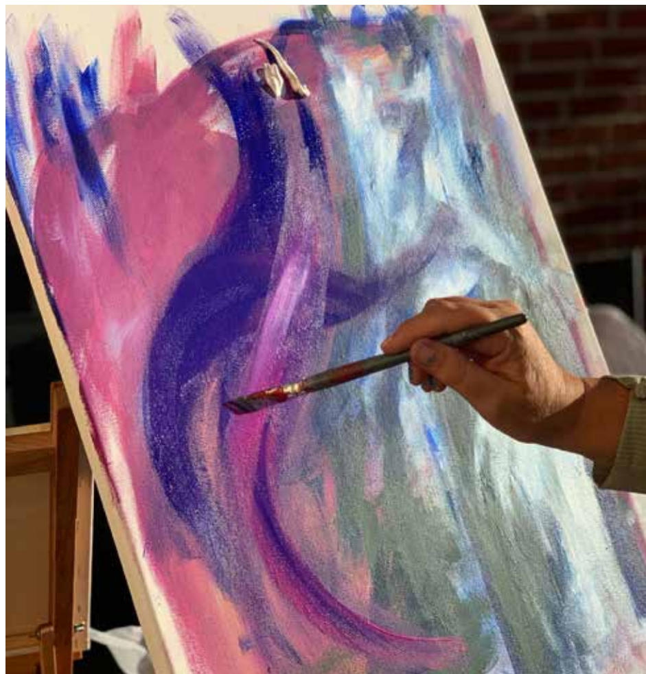
På et lerret er det plass til alle følelser.

– Og vi feirer 17. mai med grilling og gammeldagse 17. mai-leker, sier Hall. For her skal alle kunne være med, hvis de vil. Mottoet det jobbes etter: Grefsenlia – et godt sted å være!