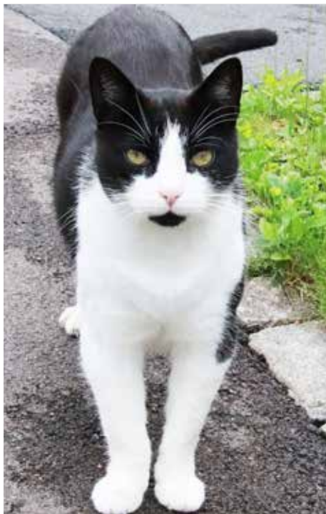
Huspusen Charlie er en populær kar.

– Erfaringer vi gjorde oss i pandemien førte til at vi opprettet stillingen for kulturmedarbeider. Først var det en 40% stilling som nå har økt til 80%, opplyser Hall.