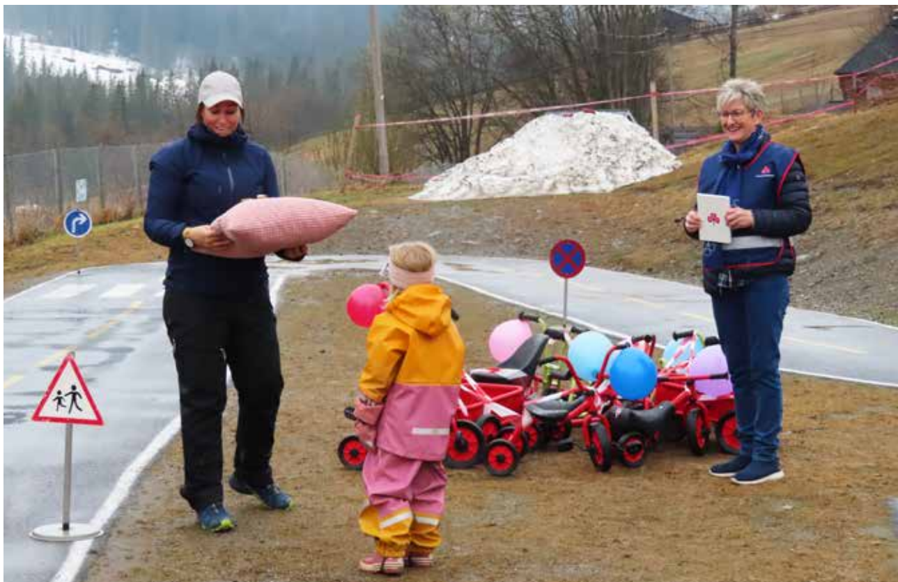
Det gikk høytidelig for seg da smårollingene i Reinli barnehage fikk flunkende nye sykler.

Lokale saker er vel mitt hjerte nærmest. Vi har budsjett på 40.000 kr årlig og har konsentrert oss om større saker som Blærescanner til bruk hovedsakelig i eldreomsorgen, karusellhuske til barne-skolen og sykler til barnehagen i vår del av