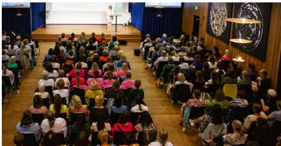
Til tross for kapasitet på over 300 publikummere så var det venteliste når Bergen sanitetsforening holdt sin kvinnehelsekonferanse i juni.