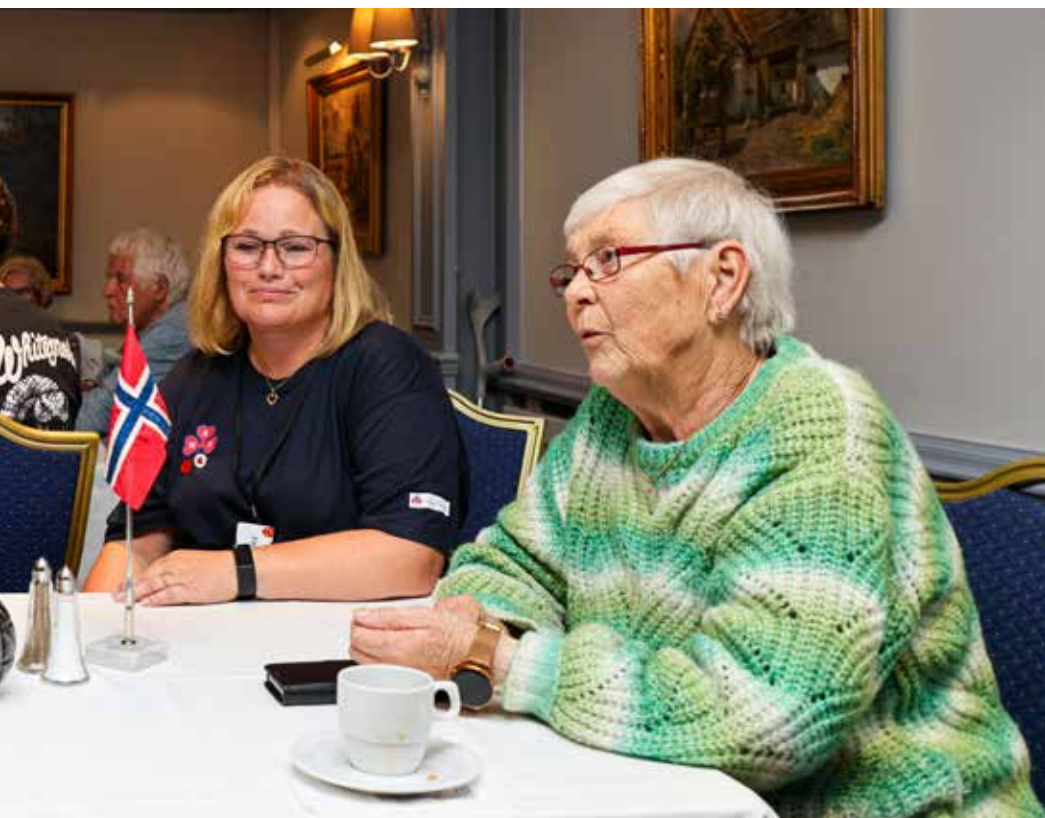
I forbindelse med ekstremværet reiste Kronprins Haakon for å møte evakuerte familier, redningsmannskaper og frivillige som stilte opp for lokalsamfunnet sitt. Her på Klækken hotell.