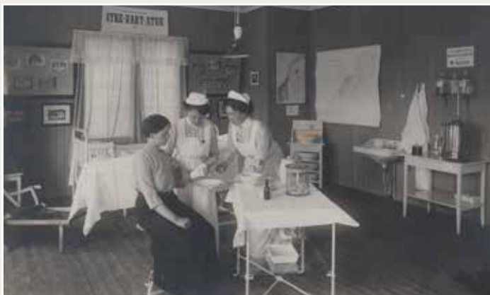
Inne fra sykestua

Jubileumsutstillingen i Frognerparken i 1914 markerte hundreårsjubileet for Norges grunnlov. Fra mai til oktober var mer enn halvannen million mennesker innom utstillingen, for å ta en titt innom de hundrevis av større og mindre bygninger og paviljonger på utstillingsområdet. Sanitetskvinnene fikk her vist frem sitt sanitetsmateriell, samt demonstrere sykesøstrenes arbeid på sykestua.