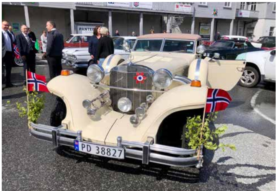
Mange steder i landet er det både kortesjer til vanns og til lands på 17.mai. Her er det en veteranbilklubb som ikke kunne tenke seg å legge ut på tur uten en Maiblomst.