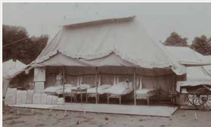
Slik så lasarettet ut fra utsiden.

Nye tider nye utstillinger. Dette er fra den store Hjem og Hobby messa på Sjølyst, og året er 1984. Rundt 95 000 mennesker var innom hallen for å se hva blant annet Sanitetskvinnene kunne by på.