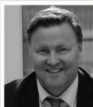
Espen Rostrup Nakstad