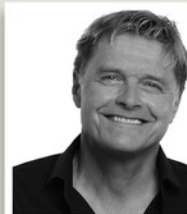
Dag Otto Lauritzen