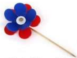
Enkel kr. 40,-