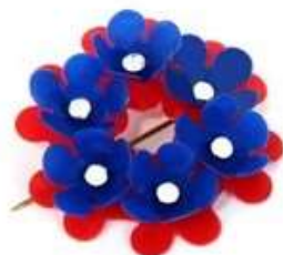
Maikrans kr. 90,-

lokal vri, oppfordrer vi til å opprette egne arrangement på Facebook slik at dere kan invitere til fysisk deltakelse ved deres arrangement.