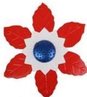
Bilblomst kr. 100,-