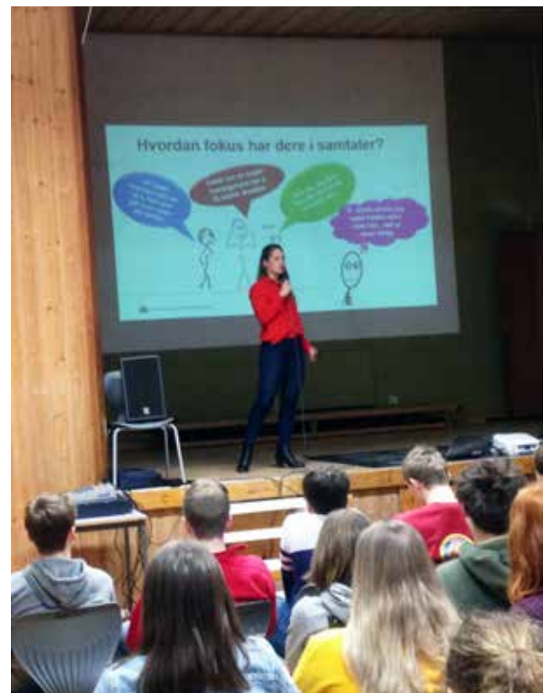
Lærerikt møte om skjønnhetstyranniet. I mars arrangerte Rødenes sanitetsforening temadag på Marker skole om sunn kroppsopplevelse, og å lære å bli glad i kroppen sin.