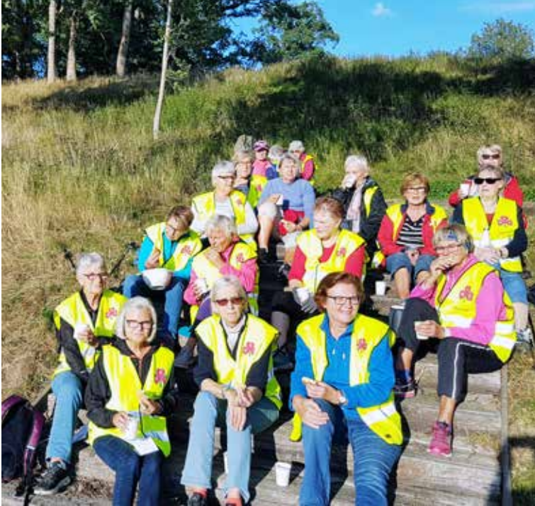
Kløvertur på krigshistorisk grunn. Åsgårdstrand sanitetsforening hadde rekorddel- takelse på sin Kløvertur. Målet var å besøke Berg som var interneringsleir under krigen.