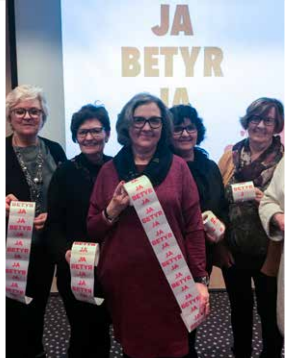
Våren 2018 reiste lokale sanitetsforeninger rundt på skoler i hele landet og snakket med russerne om Ja betyr Ja. Hele 200 000 russ er nådd med budskapet og kampanjefilmen i sosiale medier. Sanitetskvinner fra Møre og Romsdal viser her frem klistremerkene som ble delt ut til russerne.