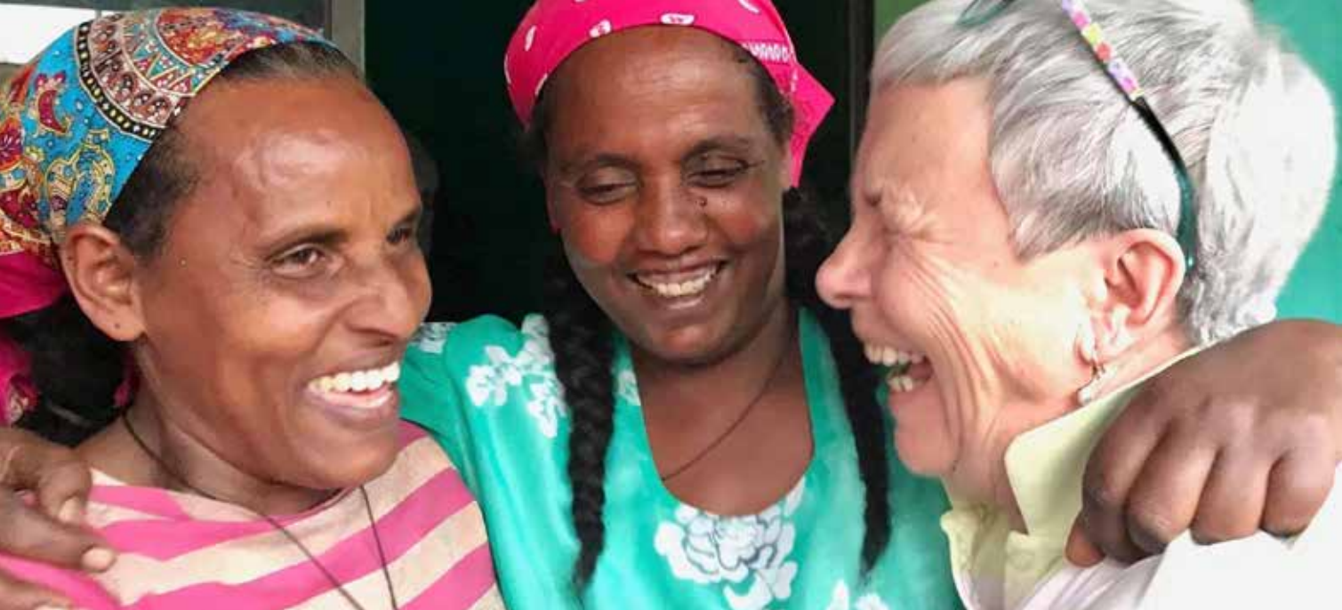
Trondhjem sanitetsforening har en fadderordning i Asossa i Etiopia.

pensjonister. Av de 56 lokalforeningene som fikk økonomisk tilskudd fra Norske Kvinners Sanitetsforening rapportere 25 % at de samarbeidet med sykehjem/eldresenter for å få med de eldste eldre på tur. Målet med Kløverturer er blant annet at alle som deltar skal få frisk luft og oppleve gleden av fysisk aktivitet. Å forebygge ensomhet og isolasjon er også et viktig mål med aktiviteten.