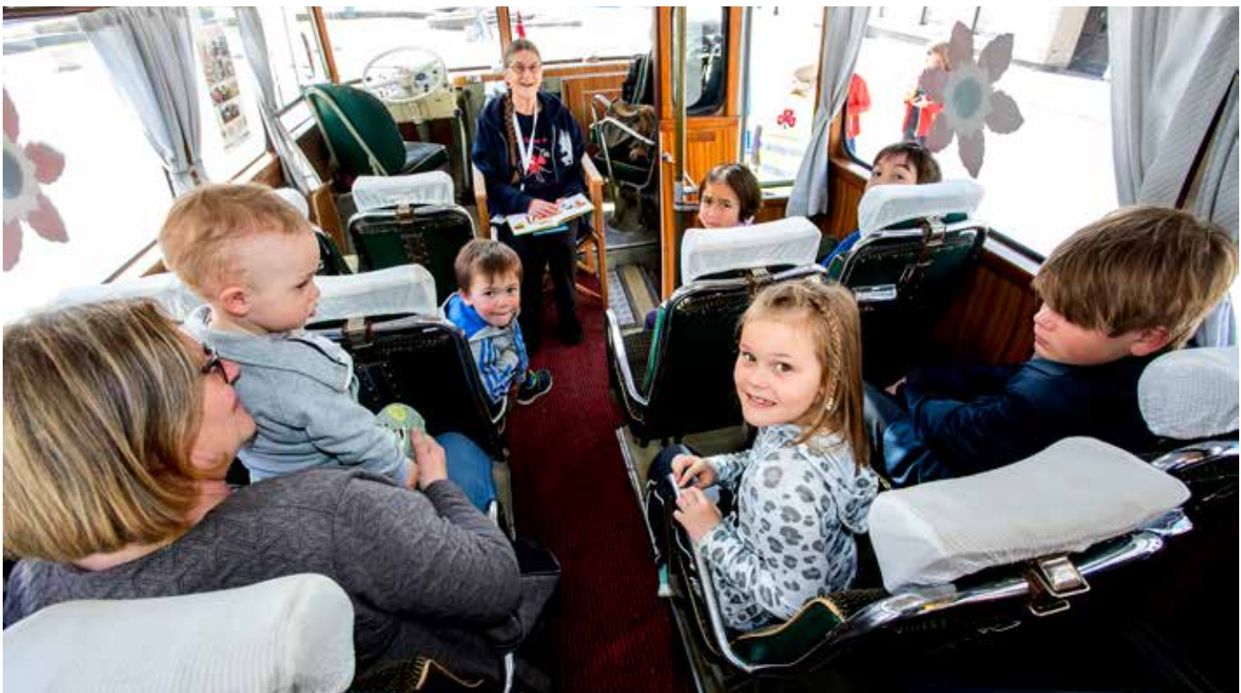
Blomstrer igjen for barn og unge. Ingen blomst i Norge har gjort like stor forskjell som Maiblo- msten, og den er derfor Sanitetskvinnenes sterkeste symbol for arbeidet rettet mot barn og unge. I skien ville alle bli leste for av sanitetskvinner fra Telemarks da «Maiblo- mstekspressen» kom på tur.