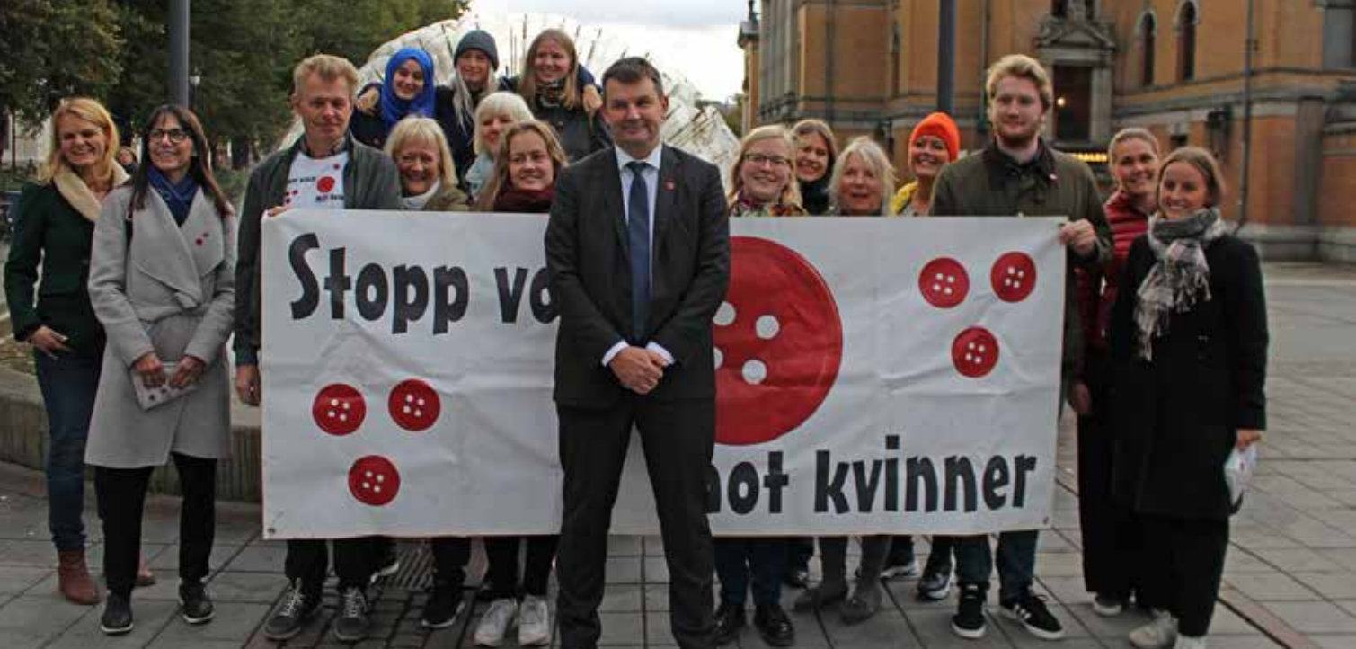
Rød knapp-alliansen er et samarbeid med seks organisasjoner som står sammen for å stoppe volden mot kvinner. Her fra et arrangement sammen med tidligere justisminister Tor-Mikkel Wara.