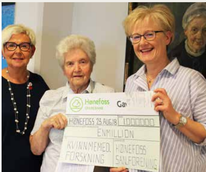
Hønefoss sanitetsforening kom i 2018 med sjekk på en million kroner øremerket kvinnehelseforskning

Norske Kvinners Sanitetsforening har stått for forskning og utvikling siden 1916, og vi arbeider fortsatt aktivt for å tette kunnskapshull på kvinners helse. Vi arbeider for å inkludere kjønnsperspektiv i diagnostisering, behandling og rehabilitering. Sanitetskvinnene støtter forskning på kvinnesykdommer, sykdommer som oftere rammer kvinner, og sykdommer som gir andre symptomer enn hos menn.