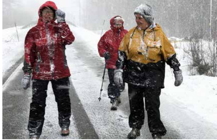
I snøfokk og kulde - Kløverturer arrangeres i hele landet, uansett vær, bare gode klær!

foreninger blant annet servert skolemåltid, hatt leksehjelp, arrangert ferie- og sommerleir, og hatt arrangementer for barn i forbindelse med jul og andre høytider.