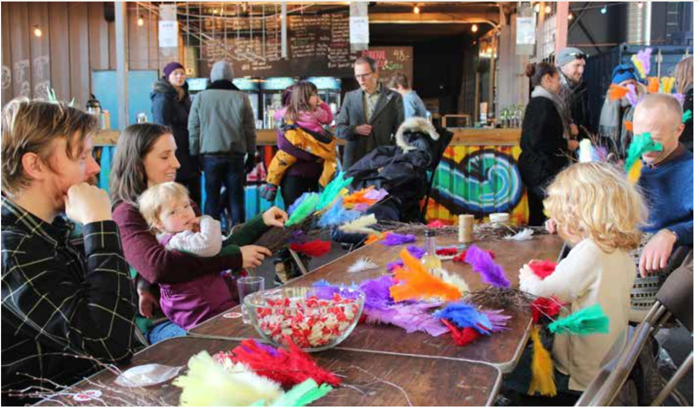
Fastelavnsverksted på Mathallen Vippa i Oslo. Sanitetsforeningene i Oslo inviterte til verksted for store og små for å binde fastelavnsris i alle slags farger.