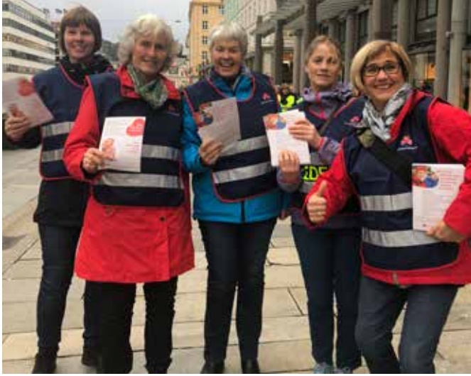
Sanitetskvinner fra Hordaland bidrar i den nasjonale dugnaden «Sammen redder vi liv».